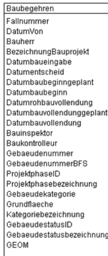
Abb. 2 UML-Diagramm des Kantons

Das UML-Diagramm dient zur grafischen Darstellung der Klassen, Schnittstellen sowie deren Beziehungen.