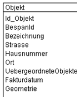
Abb. 2 UML-Diagramm des Kantons

Das UML-Diagramm dient zur grafischen Darstellung der Klassen, Schnittstellen sowie deren Beziehungen.