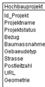
Abb. 1 UML-Diagramm des Kantons

Das UML-Diagramm dient zur grafischen Darstellung der Klassen, Schnittstellen sowie deren Beziehungen.