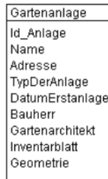
Abb. 2 UML-Diagramm des Kantons

Das UML-Diagramm dient zur grafischen Darstellung der Klassen, Schnittstellen sowie deren Beziehungen.