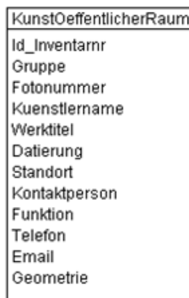
Abb. 2 UML-Diagramm des Kantons

Das UML-Diagramm dient zur grafischen Darstellung der Klassen, Schnittstellen sowie deren Beziehungen.