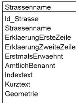
Abb. 2 UML-Diagramm des Kantons

Das UML-Diagramm dient zur grafischen Darstellung der Klassen, Schnittstellen sowie deren Beziehungen.