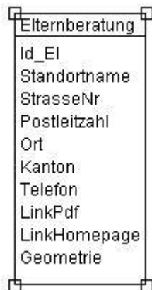
Abbildung 2: UML-Diagramm des Kantons

Das UML-Diagramm dient zur grafischen Darstellung der Klassen, Schnittstellen sowie deren Beziehungen.