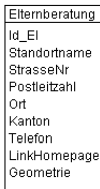
Abbildung 2: UML-Diagramm des Kantons

Das UML-Diagramm dient zur grafischen Darstellung der Klassen, Schnittstellen sowie deren Beziehungen.