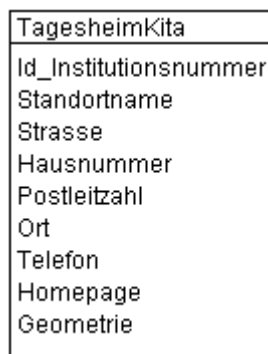
Abbildung 2: UML-Diagramm des Kantons

Das UML-Diagramm dient zur grafischen Darstellung der Klassen, Schnittstellen sowie deren Beziehungen.